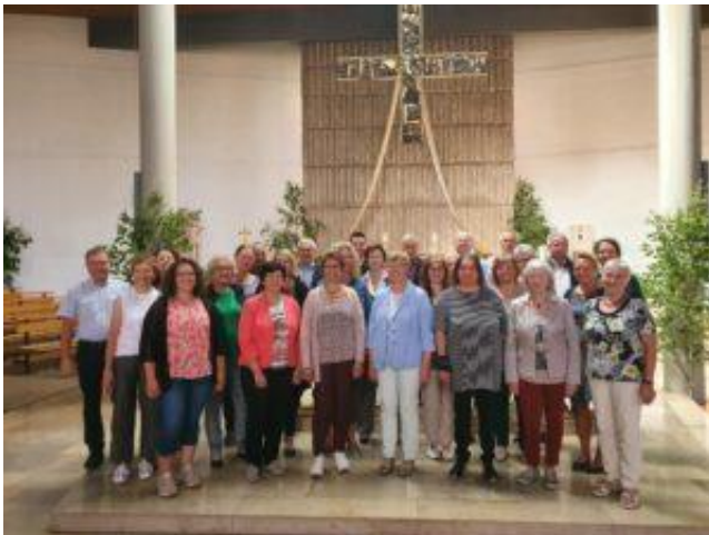
Kirchenchor Neuhaus beim Kirchweihfest 2023

Der Kirchenchor freut sich über jede neue Stimme!